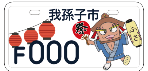
▲ふさだ だしおのナンバープレート

平日の相談が困難な方などのために、市税休日納税相談窓口を開設します。期限内の納付が困難な場合は、必ずご相談ください。当日は、電話でのお問い合わせのほか、窓口での納付も受け付けますので、ご利用ください。 日時 12月17日(土)・18日(日) 午前9時～午後4時 場所・☎ 収税課(市役所本庁舎1階)・内線366 (当日は ☎7185-1134)