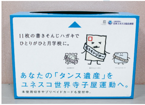
図 AIRA事務局 7183-1231 我孫子市国際交流協会(AIRA)ではユネスコの寺子屋運動(全ての子どもたちが学校に通えるよう、また成人女性の識字率が向上することを目標とした運動)に協力するため、書き損じはがきを集めています。52円の書き損じはがきで、47円の募金ができます。ご協力をお願いします。※宛名や住所はマジックなどで塗りつぶしてお持ちください。 回収箱設置場所 あびこ市民プラザ、アビシルベ、アビスタ、各行政サービスセンター、AIRA事務局

日時 12月10日(土)午前9時～午後4時 場所 市民課(市役所本庁舎1階) 受付業務 マイナンバーカードの交付・申請、市役所に郵送戻りになった通知カードの交付 ※マイナンバーカードの申請は任意です。 ☎ 市民課・内線406、422