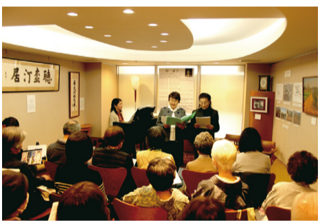
▲白樺サロンのひとときの様子

てみませんか。 日時 6月24日(土)午前9時集合、正午終了予定(荒天時7月1日(土)に延期) 集合 新木駅南口 内容 新木駅、観音寺、将門の井戸、将門神社、中里の森、中里諏訪神社、保健センター、湖北駅南口着(約4.5km) 対象・定員 自力で5km以上歩ける方、先着30人(小学生以下は保護者同伴) 費用 200円(保険料) 持ち物 歩きやすい服装、飲み物、敷物、タオル、ポール(お持ちの方。無料貸し出しあり) ■・■ 6月14日(水)必着で、はがきまたはファクスに住所・氏名・年齢・電話番号・ポールの有無を明記。 〒270-1116 我孫子1684 教育委員会文化・