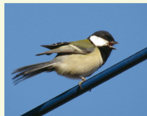
▲第7版で学名が変わったシジュウカラ

内容 日本鳥類目録第7版は分子系統学の成果によって第6版から分類が一新されています。第7版で用いられた学名がどんな研究成果によって裏付けられるか調べた結果を紹介します。