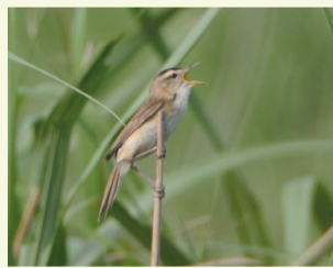
▲さえずるコヨシキリ