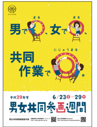
▲内閣府平成29年度男女共同参画週間ポスター

さらに6月23日からは国の「男女共同参画週間」が始まります。そのポスターに描かれた今年度のキャッチフレーズは「男で〇、女で〇、共同作業で◎」。女性も男性も、自らの意思により個性と能力を発揮して、活躍できる職場を作ろうという思いが込められています。