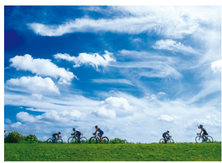
優秀賞「巻雲乱舞の空の下」