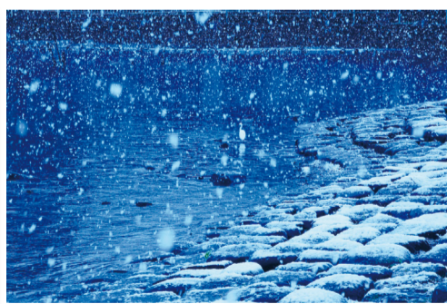
最優秀賞「吹雪く朝」