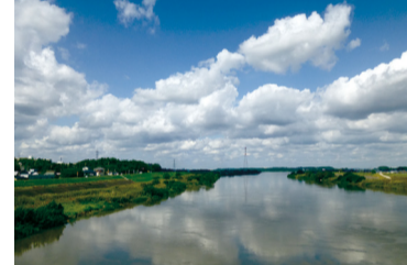
▲栄橋付近から見た利根川

内容 流域面積日本一の、かつて水運で賑わった雄大な利根川を見て、手賀沼干拓地まで布佐の里道を歩き、旧井上家住宅に立ち寄ります。散策時には、開催中の我孫子市国際野外美術展も楽しめます。