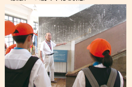
▲袋町小学校平和資料館の見学