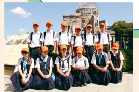
▲原爆ドーム前で平和を祈念