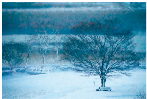
最優秀賞「けやきー雪の中にー」