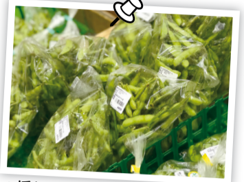
▲採れたての枝豆は味が違います!

※8月31日(金)までは毎週水曜日を除いて平日午後も2回上映(上映時間、内容などはお問い合わせください)。水の館 ☎7184-0555