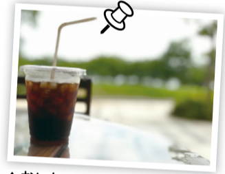
▲おいしいコーヒーをテイクアウトで