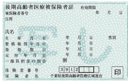
▲有効期間：8月1日～令和7年7月31日