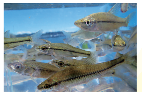
▲手賀沼で見られるモツゴなど