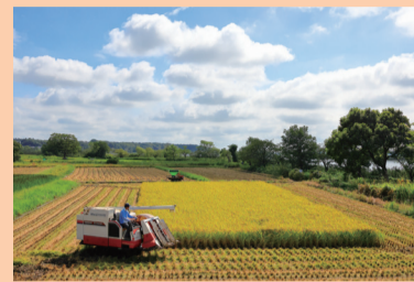
▲優秀賞「最後の一枚」