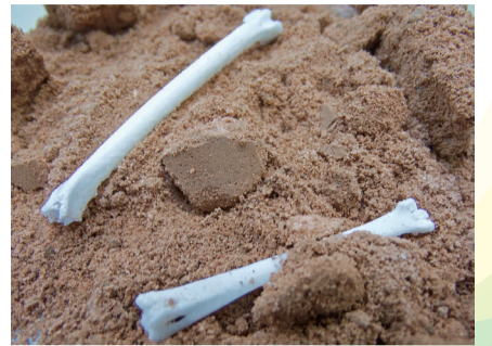
▲骨のレプリカのイメージ

日 8月24日(土)13時30分～15時 内 砂に埋まっている骨のレプリカを掘り出し、何の鳥の骨か、どのような環境に住んでいたかを想像しましょう。骨のレプリカはキーホルダーにして持ち帰れます。 対 小・中学生※小学3年生以下は保護者同伴 定 先着15人 費 無料