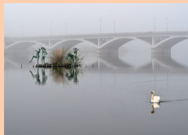
▲最優秀賞「霧中の輝」