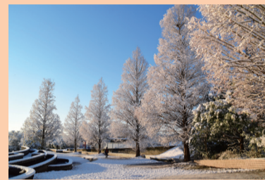
▲優秀賞「白銀の花咲いた」