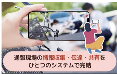
通報現場の情報収集・伝達・共有をひとつのシステムで完結