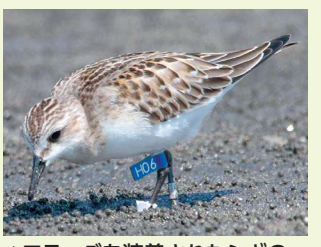
▲フラッグを装着されたシギの仲間のトウネン