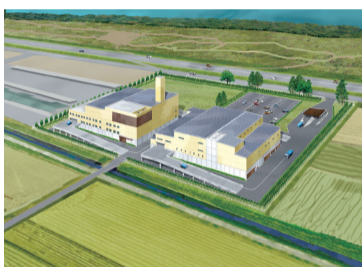
▲新クリーンセンター（イメージ図）

※土壌汚染対策工事実施設計、新廃棄物処理施設の建設及び運営・維持管理の事業者を決定します。