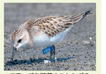
▲フラッグを装着されたシギの仲間のトウネン