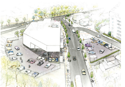
▲手賀沼公園・久寺家線(イメージ図)