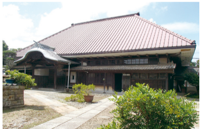
▲旧井上家住宅の母屋