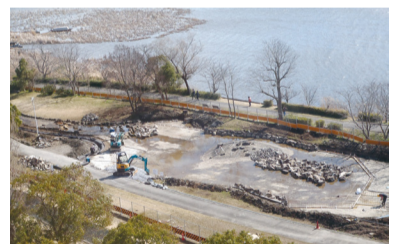
▲整備中のじゃぶじゃぶ池