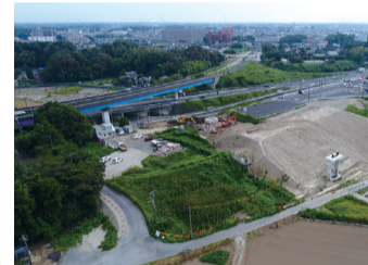
▲整備中の後田樋管工事