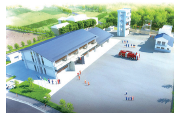
▲消防施設・総合訓練施設（イメージ図）

※東消防署湖北分署と総合訓練施設の整備に向けた中里地区の用地取得などを進めます。