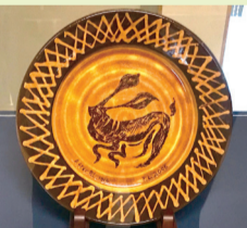
▲展示中のフィリップ・リーチ(孫)の作品

100年前の1919年は柳宗悦邸のバーナード・リーチの窯が焼失した年です。リーチは失意のうちにありましたが、最後の作品に感動を覚え、柳にその作品を贈ります。その作品のモチーフとなった動物はどれでしょう?