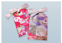
▲Good luck charm(お守り)

申・問 12月3日(火)午後5時までに電話・ファクス・Eメールで住所・氏名・年齢・性別・電話番号を明示。ボランティア市民活動相談窓口で・と・り・あ ☎7185-5233 ☎7185-5243 ✉avc@abiko-shakyo.com