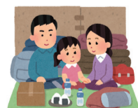
図 市民安全課・内線217