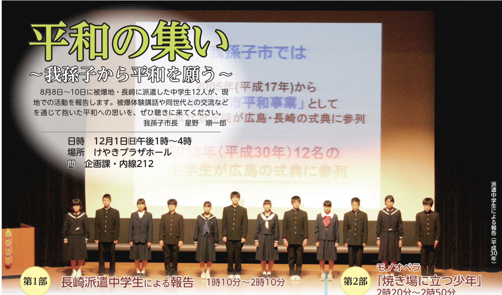
派遣中学生による報告(平成30年)