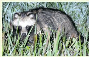
▲利根川の河川敷に生息するタヌキ

日時 12月7日(土)午後4時～7時※荒天中止 場所 利根川ゆうゆう公園※野球場駐車場集合 内容 夜になると河川敷に出てくるタヌキ・ノウサギなどの哺乳類や、夜行性の鳥たちを観察します。 定員 先着20人(要申込)※小学生以下は保護者同伴 費用 100円(保険料) 持ち物 歩きやすい靴・服装、防寒着、双眼鏡・懐中電灯(お持ちの方)