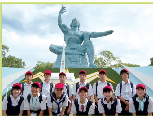
▲平和祈念像と派遣中学生12人

私たち派遣中学生12人は、長崎でさまざまな体験をし、非常に充実した日々を送ることができました。