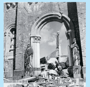
▲浦上天主堂