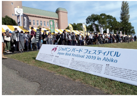
▲ジャパンバードフェスティバル2019

「人と鳥の共存をめざして」をテーマに、毎年秋に、鳥を愛する人たちが、自然環境を大切に人たちが集まり、日ごろの研究や活動の成果などを発表するイベントです。※新型コロナウイルス感染症の影響により、開催を中止する場合があります。出展料金の請求は、開催確定後(8月5日(水)予定)となります。