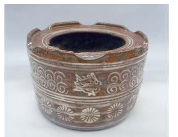
▲河村蜻山作 灰落とし