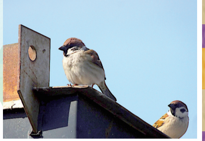
▲人工構造物を利用するスズメ