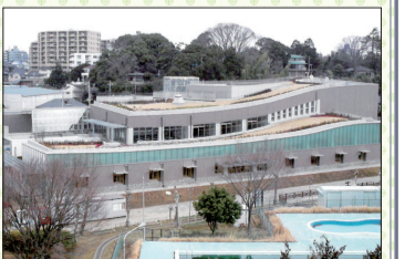
▲開館当時のアピスタ