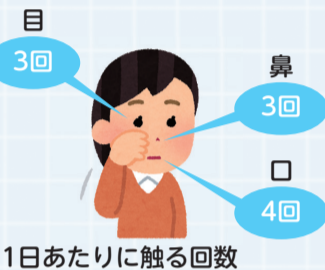
1日あたりに触る回数

人は1日の間に無意識に顔を触っています。そのうち目、鼻、口などの粘膜は約44%を占めています。