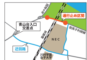
▲通行止め区間・迂回路図

期間 10月上旬~中旬の10日間程度(予定) 時間 午後9時~翌午前5時 場所 青山地先(右図参照)※全面通行止め 〓 (発)千葉県柏土木事務所☎7167-1201 (受)博正建設☎7182-4165