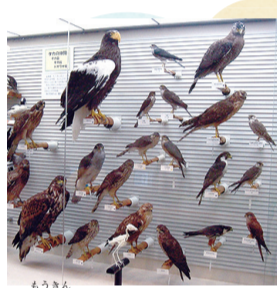
▲猛禽類の標本展示