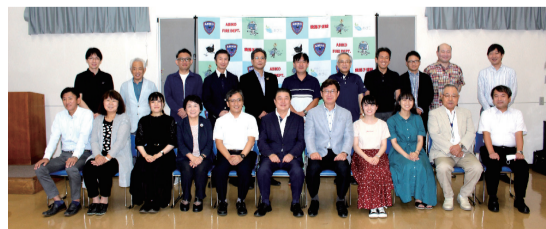
▲我孫子市総合計画審議会