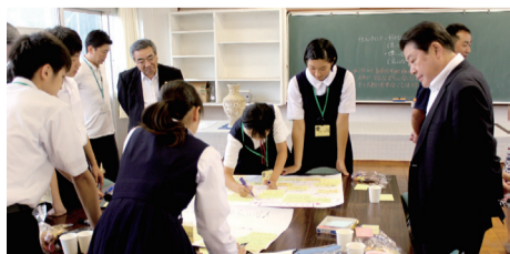
▲中学生まちかいぎ