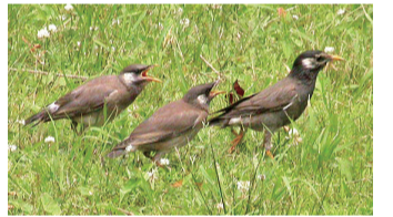
▲親鳥に餌をねだるムクドリのヒナ