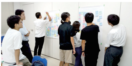
▲高校生まちかいぎ