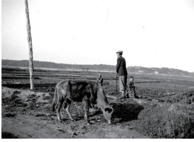
▲手賀沼沿岸の水田(杉村家蔵)

杉村楚人冠が書き残した随筆と、我孫子に残る民具などから、大正～昭和初期の我孫子の様子が浮かび上がります。市制施行50周年を機に、我孫子の歴史をもっと知ってみませんか。