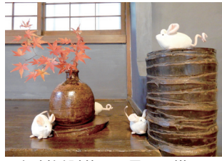
▲旧村川別荘での展示の様子