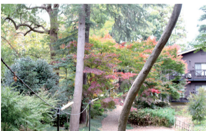
▲日立アカデミー我孫子キャンパス

市長：我孫子の魅力の一つ、手賀沼の水辺空間は癒やされる場所なんです。嘉納治五郎や志賀直哉ら多くの文化人も手賀沼の魅力に引かれ我孫子に居を構えました。実は、今回座談会の会場となっている日立アカデミー我孫子キャンパスも日本郵船の社長だった大谷登さんの別荘跡なんです。皆さんのような若い世代にとっては、我孫子の魅力ってどのようなところですか。