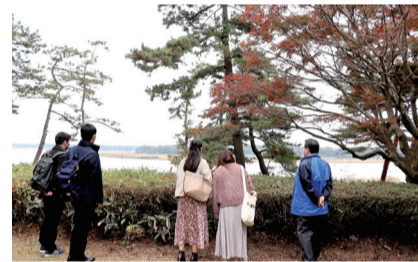
▲日立アカデミーから望む手賀沼

かけにこれまで多くの人に支えられて生きてきたことを改めて考えるようになりました。先輩や同期、多くの人間関係に恵まれて生きてきて、人と人のつながりがとても大切なものだと感じています。自分が他の人にどのような影響を与えられるかまだ分かりませんが、街づくりやマスコミ関係だった