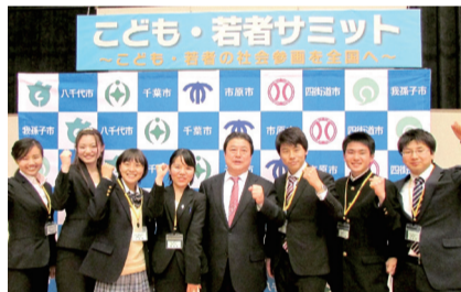
▲こども・若者サミットの参加者

橋本さん：とても評価が良かったのを覚えています。他の事例が小学生中心だったからかな(笑) 我孫子市の被爆地への中学生派遣やリレー講座は質が高く、他に誇れる事業だと思っています。リレー講座をしていると、小学生から