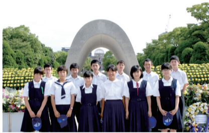
▲広島派遣に参加した中学生(平成26年当時)