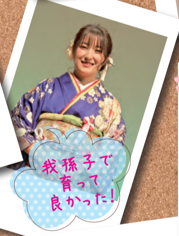
我孫子で 育って 良かった!