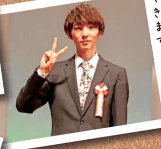
将来、 我孫子に帰っ てきます。 教員になっ てます。