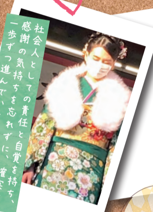
感謝の気持ちを忘れずに、確実に 一歩ずつ進んでいきます。