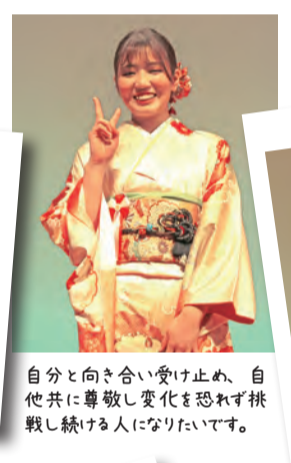
自分と向き合い受け止め、自 他共に尊敬し変化を恐れず挑 戦し続ける人になりたいです。