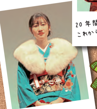
今まで支えてくれた家族、 友達ありがとう。