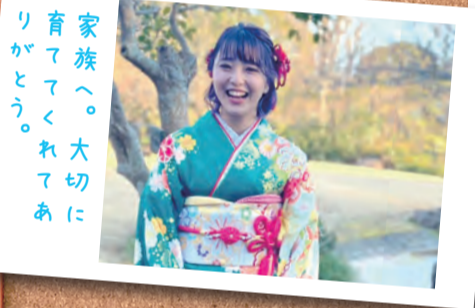
家族へ。大切に 育ててくれたあ りがとう。