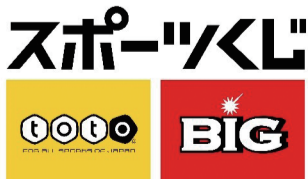
図 教育委員会文化・スポーツ課 ☎7185-1604