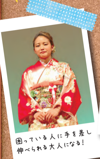
困っている人に手を差し 伸べられる大人になる!