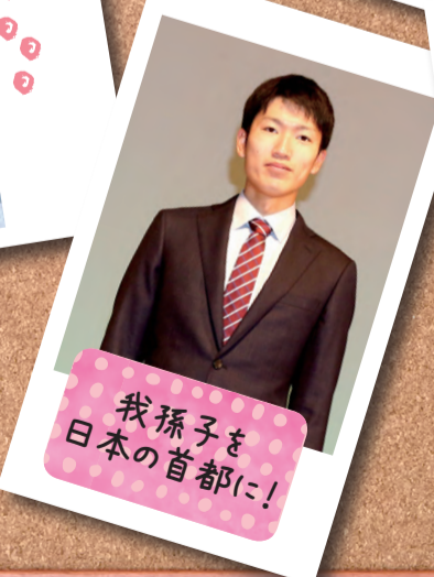
我孫子を 日本の首都に!