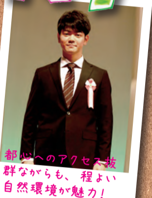
都心へのアクセス披 群ながらも、程よい 自然環境が魅力!