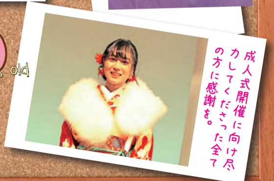
成人式開催に向け の方に感謝を。 カシメタカ