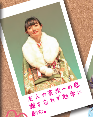
友人や家族への感 謝を忘れず勉学に 励む。