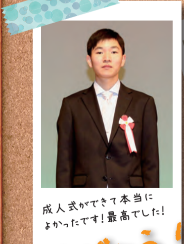
成人式ができて本当に よかったです!最高でした!