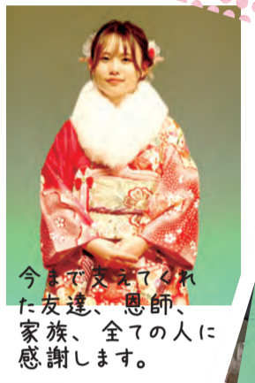
今まで支えてくれ た友達、恩師、 家族、全ての人に 感謝します。