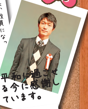
平和に過ぎる 今に感謝し ています。