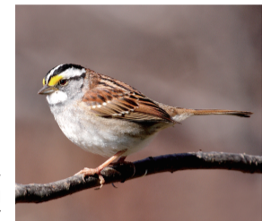
▲ノドジロシトド白色型オス