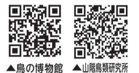
▲鳥の博物館 ▲山階鳥類研究所