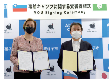
▲アンナ・ボラック・ペトリッチ駐日スロベニア大使と星野市長

スロベニア共和国 面積: 2万273km 2 (四国とほぼ同じ) 人口: 約209万人(2019年・世銀) 首都: リュブリャナ 言語: スロベニア語