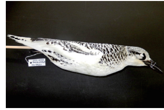
▲アカオネツタイチョウの仮剥製標本

Abiko City Museum of Birds 234-3 Konoyama Abiko 図 ☎7185-2212