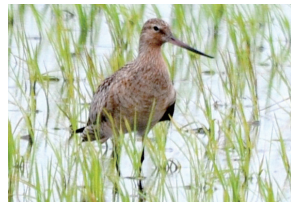
▲一度に飛ぶ距離のチャンピオン、オオソリハシシギ

日時 7月17日(出)～11月28日(日) 場所 鳥の博物館2階企画展示室 内容 鳥類は生活のために、驚くべき身体の仕組みやさまざまな能力を持っています。今回は日本でのオリンピック開催にちなみ、鳥の大きさ、飛翔能力、視力・聴力などの感覚器官、寿命などについて「チャンピオン」を選び、その記録や能力を紹介します。 入館料 300円(大学・高校生200円、中学生以下・70歳以上無料)