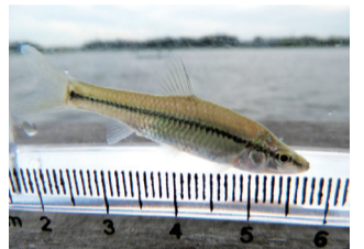
▲手賀沼でよく見られるモツゴ