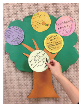
▲図書館の木(イメージ)