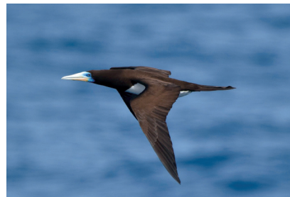
▲かつて南鳥島で繁殖していたカツオドリ

視聴方法 鳥の博物館ホームページ(QRコード参照)に掲載のリンクから動画サイトで配信