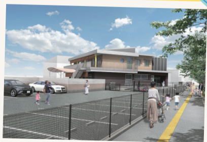
▲駐車場イメージ(令和5年2月完成予定)