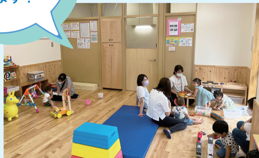
▲新しく開設した「すまいる広場」の様子