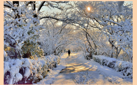
▲優秀賞「手賀沼の初雪」