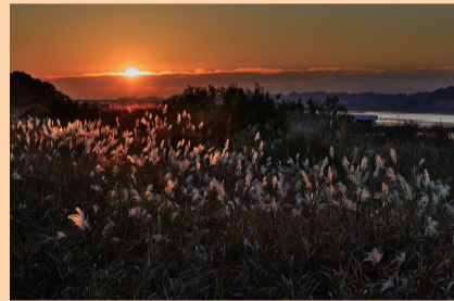
▲最優秀賞「暮秋の輝き」