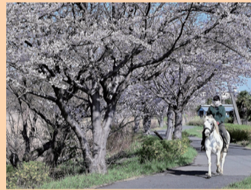
▲優秀賞「櫻下の白馬」