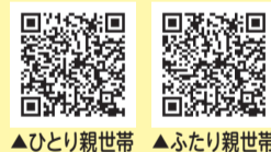
▲ひとり親世帯 ▲ふたり親世帯

令和4年4月分の児童扶養手当を受給していない方は申請が必要です。公的年金などの受給で児童扶養手当が全額停止になっている方や、所得制限で児童扶養手当が全額停止となっているが、児童扶養手当の所得制限基準まで所得が下がった方が対象です。