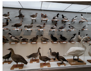
▲カモ目の標本展示

鳥の博物館では、日本産鳥類全種の剥製標本の収集を目標に資料を集めています。現在、日本産鳥類633種の6割に当たる389種の標本を収蔵しています。集めた標本を公開し、多様な日本の鳥を紹介します。 日時 2月18日(出)～6月25日(日)午前9時30分～午後4時30分※月曜休館(祝日の場合は翌平日) 場所 鳥の博物館2階企画展示室 入館料 300円(高校・大学生200円、中学生以下・70歳以上無料)