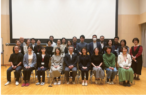
▲令和4年度の修了生

日 9月10日(日)・24日(日)、10月8日(日)・22日(日)9時15分～17時 所 市役所分館会議室 内 専門家の講義、创业者の事例紹介、グループワークなど ※修了生は、法人設立時の登録免許税の軽減、創業関連保証額の拡充、市の創業支援補助金の補助対象資格などの特典あり 対 市内で起業・創業を目指す方、創業から5年以内の市内事業者 定 先着25人 費 8,000円 申・問 9月7日(木)までに電話・ファクス・Eメールで住所、氏名、電話番号、Eメールアドレスを明示。NPO法人ACOPA ☎04-7181-9701 FAX 04-7185-2241 ✉acoba@key.ocn.ne.jp