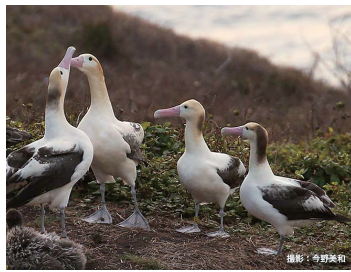
▲鳥島系アホウドリ(左2羽)と尖閣系アホウドリ(右2羽)

8月19日(土)13時30分~14時15分 最近の調査で、鳥島と尖閣諸島のそれぞれで主に繁殖するアホウドリが別種であることが分かりました。1種だと考えられていた時にはPhoebastria albatrusと呼ばれていましたが、この学名を引き継ぐのはどちらの種で、もう一方は何と呼べばよいのでしょうか?学名にまつわる最新の研究成果をお話します。