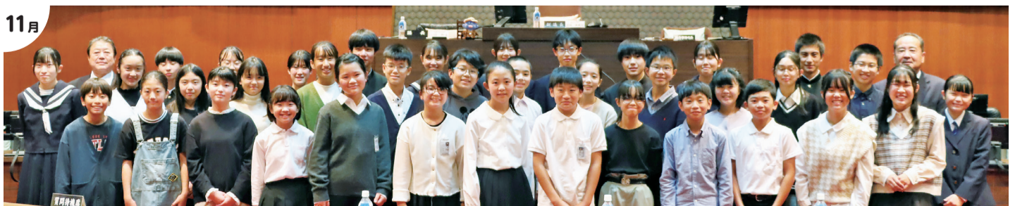
11月 第10回子ども議会

2023年は皆さんにとってどのような一年でしたか？今年新型コロナウイルス感染症が感染症法上の5類に移行し、中止していたイベントなどが再開されるようになりました。2024年も地域の魅力であふれるまちづくりを進めます。