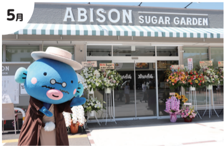
5月 [ABISON SUGAR GARDEN]グランドオープン