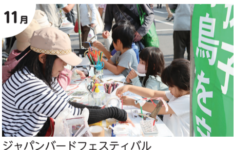
11月 ジャパンパードフェスティバル 4年ぶりに手賀沼親水広場がメイン会場