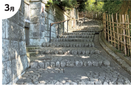
3月 「天神坂」「手賀沼周辺の公園群」 ちば文化資産に追加選定