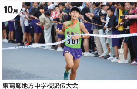
10月 東葛飾地方中学校駅伝大会 我孫子中学校 優勝、久寺家中学校 準優勝