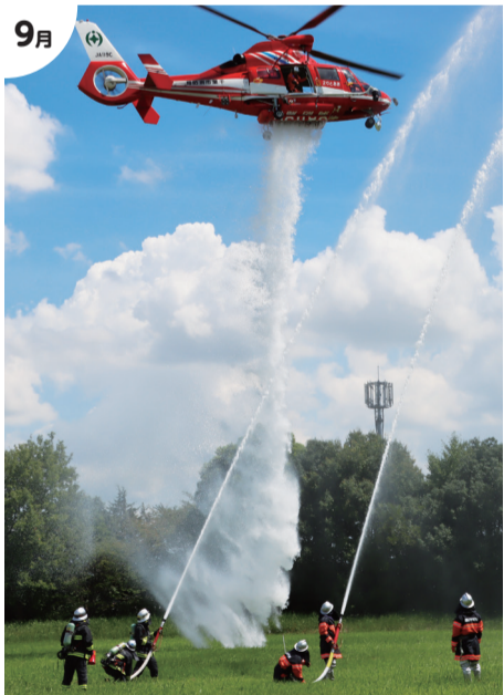
9月 九都県市合同防災訓練 我孫子市で初開催