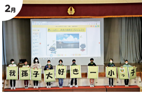
2月 我孫子第一小学校創立150周年記念式典

4月▶広報あびこリニューアル 4月▶観光情報誌「あびこさんぽ」発行 4月▶我孫子駅全ホームエレベーター完成