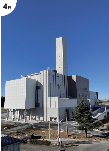
4月 新クリーンセンター本格稼働

4月▶広報あびこリニューアル 4月▶観光情報誌「あびこさんぽ」発行 4月▶我孫子駅全ホームエレベーター完成