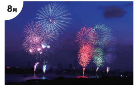
8月 4年ぶり 手賀沼花火大会