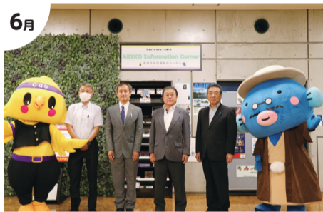
6月 中央学院大学に市の情報発信コーナー