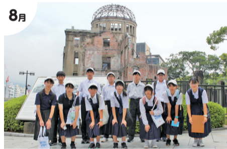
8月 市内中学生 被爆地広島市へ派遣