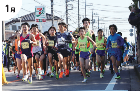
1月 3年ぶり 新春マラソン大会