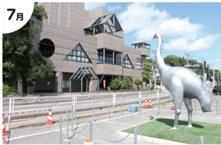
7月 鳥の博物館前にジャイアントモアのモニュメント

9月▶市の住宅地価上昇率 東京圏で1位・2位 11月▶市ホームページ トップページリニューアル 11月▶我孫子市議会議員一般選挙 新議員24人決定 12月▶関東中学校駅伝大会(男子) 久寺家中学校 初優勝、我孫子中学校 準優勝 12月▶天王台駅の一部にホームドア設置