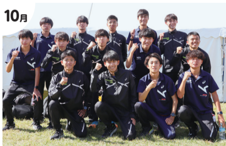
10月 中央学院大学駅伝部 第100回箱根駅伝出場決定

9月▶市の住宅地価上昇率 東京圏で1位・2位 11月▶市ホームページ トップページリニューアル 11月▶我孫子市議会議員一般選挙 新議員24人決定 12月▶関東中学校駅伝大会(男子) 久寺家中学校 初優勝、我孫子中学校 準優勝 12月▶天王台駅の一部にホームドア設置