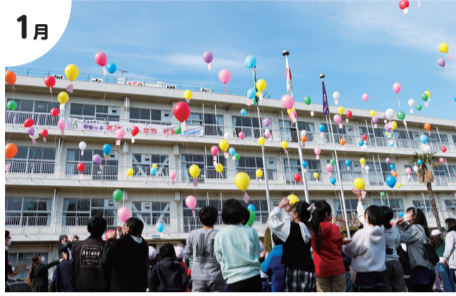
1月 布佐小学校創立150周年記念式典

発行／我孫子市 編集／企画総務部秘書広報課 広報室 〒270-1192 我孫子市我孫子1858番地 ☎04-7185-1111(代表) 04-7185-1520