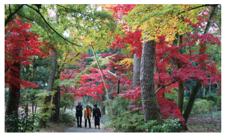
▲日立アカデミー我孫子キャンパスの庭園