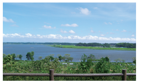
▲高野山桃山公園からの眺め (映画のロケ地にも選ばれている)