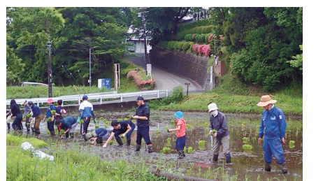
▲谷津ミュージアムの田植え体験

【住み替えVOICE】 市内に移住した方のインタビュー動画を、あびこの魅力発信室公式YouTubeで配信しています。我孫子市を選んだ理由や住んでみて感じたことなど、移住した方の生の声を発信しています。市外在住の家族・知人にもご紹介ください。