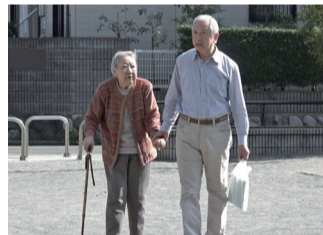
▲映画「99歳 母と暮らせば」より