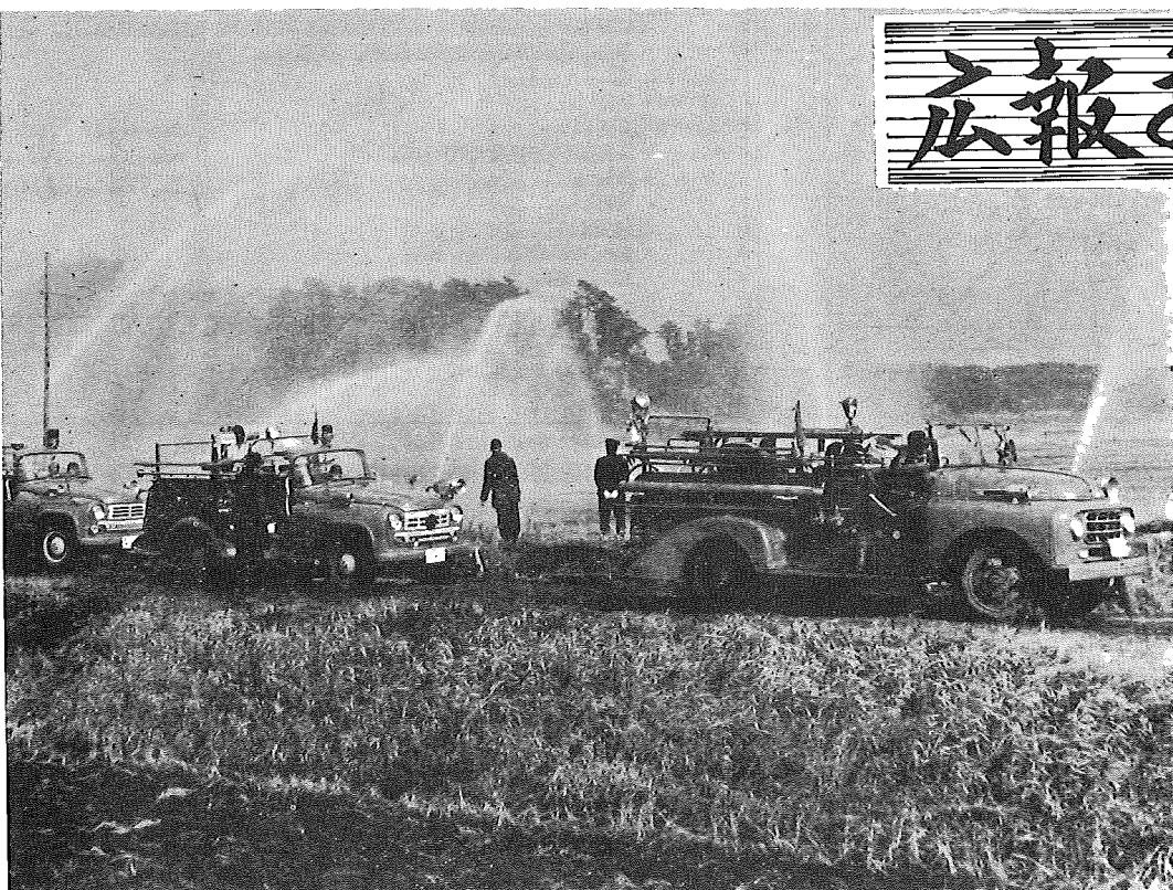
出初式最大の見もの放水式