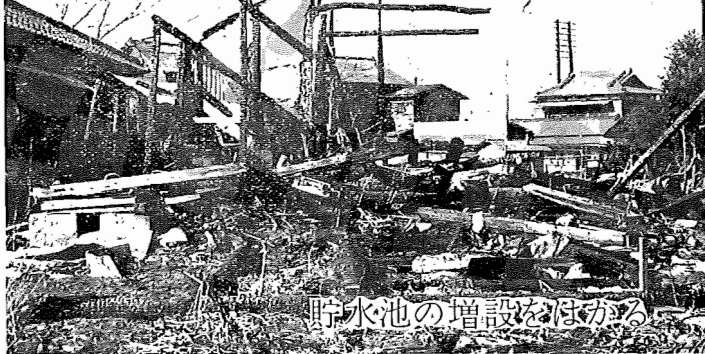
貯水池の増設をほがる