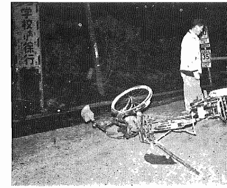
【泥酔者同士のオートバイと自転車による交通事故、一小前道路上で】

酒気おび運転の危険性 酒の影響は、飲んですぐ あられるものでなく、ある 時間を経てから徐々にあら われるもので、飲んだばかり のときは大丈夫と思っても、車 を運転しているうちに影響が 出てきます。たとえば、信号 無視、スピードのだしすぎ、 通行区分を乱すなど、事故を 起こす原因となります。 酒気おび運転は厳禁 酒気をおびているときは、 どんなに酒の強い人でも、ま た、運転に自信のある人でも 運転をすることは禁止され ます。このような状態で交 通違反を犯したときは、刑罰が 二倍になります。 酒気おび運転の 防止はみんな 運転するのなら酒を飲む な。これは安全運転のため 鉄則です。これを守るには、 本人の自覚とともに、周囲の 者が心を鬼にして、運転者 は絶対に酒をすすめないよ うにしなければなりません。 歩く人も気を付けよう 酔った歩行者の交通事故も 多く出ています。酒に酔うと 車に対する危険感がきわめて うすくなりますから、酔いが さめない間はみだりに出歩か ないよう。この点について は、周囲の人も、その間は外 出させないように配慮してや ることが大切です。