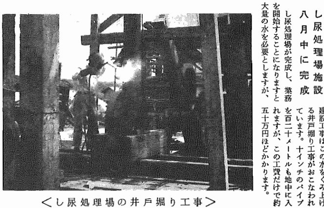
し尿処理場の井戸掘り工事

全町の家屋を資産評価 八月下旬から四カ月間 固定資産税は、土地、家屋、月一日現在の状況で評価し、価格を決定します。また、三年ごとに評価基準年度というものが設けられていて、基準年度の価格を三年間ずえで、昭和三十九年度は、この基準年度に価格が引き上げることになります。 ただし、価格の引き上げは、昭和三十九年度は、この基準年度に価格が引き上げることになります。ただし、価格の引き上げは、昭和三十九年度は、この基準年度に価格が引き上げることになります。