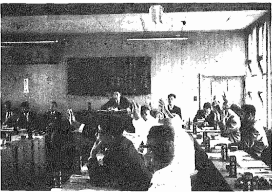
〔臨時町議会最終日、11議案を可決〕

▼赤い羽根募金 赤い羽根は、赤い羽根が「赤い羽根」で知られている共同募金運動が始まりました。赤い羽根をシンボルとするこの運動は、おたがいの力で、みんなのしあわせをつかめ、明るい地域社会をつくることにも、公けの社会福祉予算の増額をうながし、社会保障制度の確立をはかるための世論をみちびく役割をも果たしています。