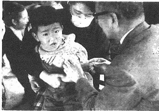
〔予防接種をして「流感」をよせつけない〕

インフルエンザ（流行性感冒）の流行の季節をむかえようとしています。町では希望者に予防接種を実施します。 ワクチンの購入などのついでにより、接種希望者の数をつかみますから、接種