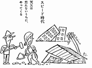
スピード時代 震害は、 あつては、 あつては、

地震の園といわれるわが国では毎年身体に感ずる程度の地震が千回ぐらいおこります。 大正十二年の関東大震災以後、現在まで特に大きなものをあげると昭和八年三月の三陸沖、昭和十九年二月の東南海地震、昭和二十一年十二月の南海道地震、昭和二十三年六月の福井地震、昭和二十七年三月の十勝地震、それにことし六月の新潟