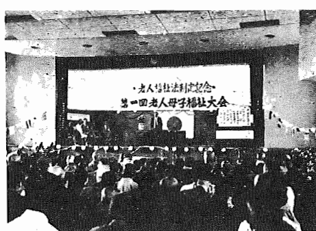
(昨年の老人母子福祉大会……一小講堂)

に努めましょう。 ③老人に慰問と激励の便りを出さう。 ④老後の生活設計を考え、所得保障、医療が推進されるよう働きかけよう。 ⑤老人に家庭での役割をあたえよう。 ⑥健康を増進し、時代におけないよう新しい感覚を身につけた老人になるよう努めよう。 ⑦老人に家庭での役割をあたえよう。