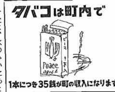
1本につき35銭が町の収入になります

裁石田礼助殿 あなたの陳情文の写を企画室までお送りください。広報あびこに掲載してこの運動を推進する場にいると思ひます。