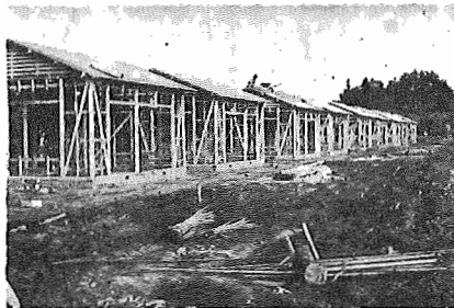
町営住宅近く完成 布佐202番地へ建設中の町営住宅(第2種)10戸は1月中旬に完成の予定で、入居は2月上旬になる予定です。

町ではいろいろな事業をおこなっていますが、事業をおこなうためには多くの経費を必要とします。この経費は、みなさんから納めていただいた税金によってまかなわれています。したがって、みなさんの納税がおくるといことは、不本意なことではありませんが、事業をおこなうためには、滞りなく納税していただく必要があります。町で計画した事業をおこなうには、やはりみなさんのご協力が必要で、滞りなく納税していただくことは、町に比較して少ないといえます。