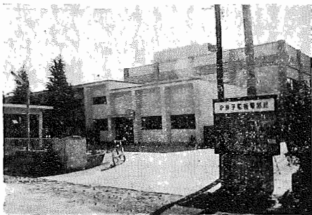
写 真 は 開 通 を 待 つ 我 孫 子 電 報 電 話 局