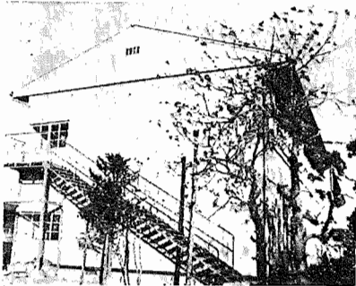
完成した第二小学校舎