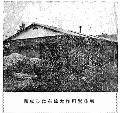
完成した布佐大作町営住宅

今年も十二月三十一日現在で、毎年行われる工業統計調査が行われます。 この調査は統計法に基づき、国の指定統計の一つで、わが国の工業の実態を明らかにする為に製造業に属する事業所、又二つ以上の事業所を営む本社、本店等について調査し、今後の国や地方公共団体の行政施策の資料として、又民間企業の経営の指針として、各方面に広く利用される重要な調査です。 この調査票に記入された内容については、厳重に秘密が守られ、統計目的以外