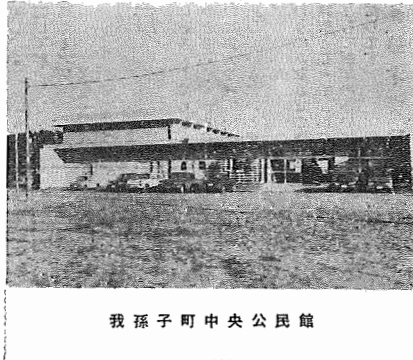
我孫子町中央公民館