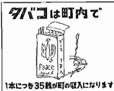
1本につき35銭が町の収入になります

改式とともに消防署の電話一〇六番（現在一般にも使用している）は、消防本部、署への通話には、（八三）二一七番が直通になって居ります。また、平日の執務時間中は、役場の内線（二三番）でも通話出来るようになっています。