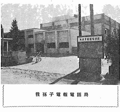
我孫子電報電話局