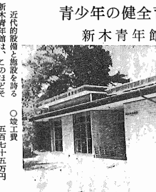
新木青年館の概要

近代的設備と施設を誇る 新木青年館は、このほどそ の竣工をみ、五月十六日午 後一時から開館式が行なわ れました。 青年館は、青少年の健全 育成の場として又地域住民 の社会福祉活動の場として 極めて意義の深いものであ り、今後の青年館活動が期 待されております。 なお、我孫子町における現 在の青年館は六館になり、 さらに四十二年度において も三館程度は建設される見 込であります。