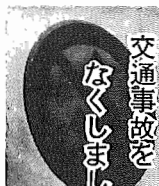
交通事故をなくしましょう

今日テレビのニュースで交通事故を知らせていただきました。一日だって交通事故のそく陸橋を作られたと聞き、めまいがした、頭痛がしたり、気分が少してせ悪くなったら医師の診断を受けること。