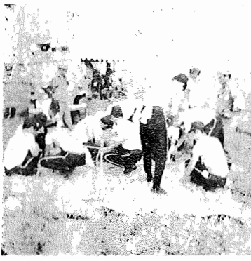
酷暑の中で水防工法に励む団員達

去る七月二十二日、柏市布施弁天地先、利根川堤防において、柏市と我孫子町の共催による水防演習が行なわれました。 当日は、三十度を越す暑さにもかかわらず、両市町長はじめ、水防団員三百八十五名は、実働ながらのようでありました。 この演習は、これから来夏が予想される台風に備えて、利根川堤防の決壊を想定し、土俵積み、五徳掘り、月の輪等、あらゆる水防工法により防備するともに、団体活動の船和と秩序を図り、水防に対する認識と技術の向上を図り、以って災害時に際して、その