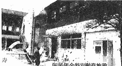
国民年金特別融資施設 保育園

かわてから建設中でありました湖北台保育園、寿保育 園の落成式と開園式が6月17日に行なわれました。 両保育園の施設の概要は次のとおりです。 湖北台保育園は鉄筋コンクリート平屋建に保育室5、乳 児室2、集中暖房方式、定員は165名です。 寿保育園は鉄筋コンクリート2階建に保育室3、乳児 室、集中暖房方式、定員は95名です。