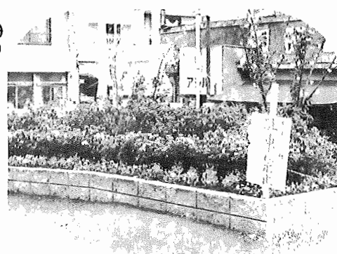
駅前広場に造られた花壇