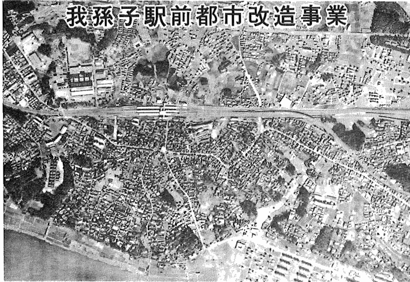
我孫子駅前都市改造事業

千葉県我孫子市役所 千葉県我孫子市我孫子1858番地 千電話あびこ(0471)82-1151(大代表) 昭和34年7月31日 第三種郵便物認可 発行日 毎月1日・16日・1部 2円